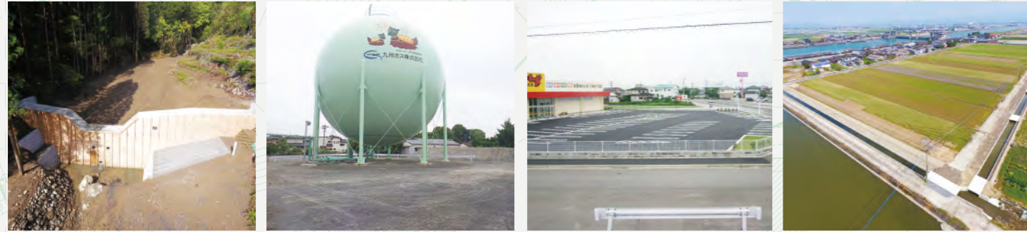
公共工事(砂防ダム) 民間工事(都市ガス関係) 民間工事(店舗外構工事) 公共工事(農業施設)